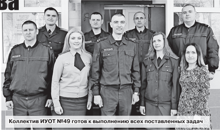
Коллектив ИУОТ №49 готов к выполнению всех поставленных задач

Полувековой юбилей – всегда значимая дата. Особенно, когда она касается тех учреждений, которые работают не просто с людьми, а с человеческими судьбами. Таковыми являются исправительные учреждения, их цель – перевоспитать, вернуть в общество законопослушными гражданами тех, кто однажды оступился.