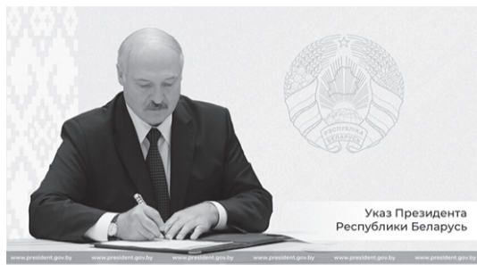
Указ Президента Республики Беларусь

Президент Беларуси Александр Лукашенко 17 апреля подписал Указ №107 «О повышении пенсий».