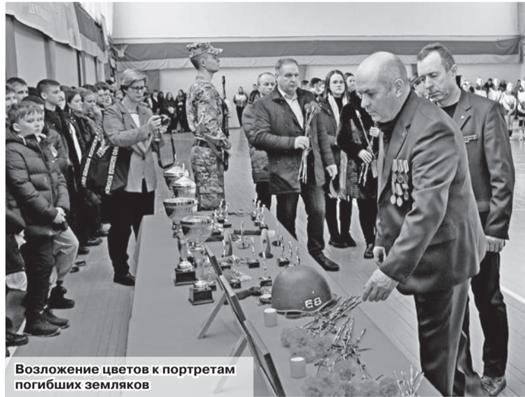
Возложение цветов к портретам погибших земляков