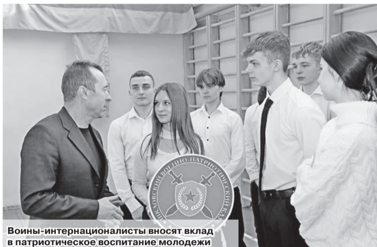
Воины-интернационалисты вносят вклад в патриотическое воспитание молодежи