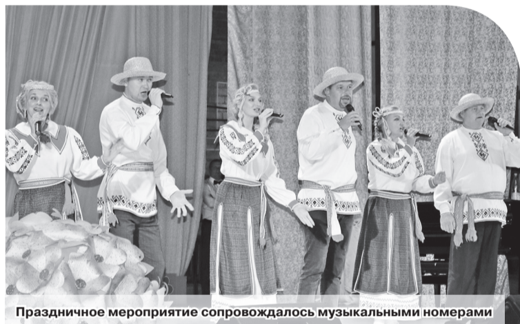
Праздничное мероприятие сопровождалось музыкальными номерами

Ольга ДАНИЛОВА assol2711@mail.ru Фото автора