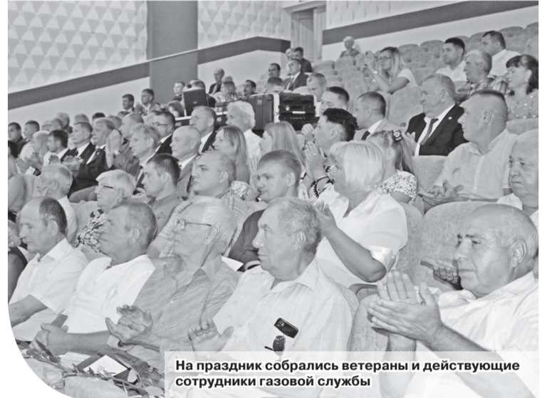
На праздник собрались ветераны и действующие сотрудники газовой службы

В соответствии с постановлением Совета Министров БССР от 19 апреля 1962 г. №205 и на основании приказа начальника Главного Управления по газификации при Совете Министров БССР от 22 июня 1972 г. №92 с 1 августа того же года создана Шкловская хозрасчетная эксплуатационно-монтажная контора по газификации. Именно с этого момента и началось формирование коллектива Шкловского района газоснабжения, который в этом году отмечает свое 50-летие.