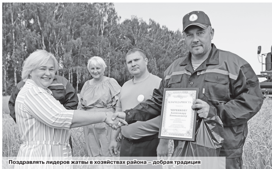
Поздравлять лидеров жатвы в хозяйствах района – добрая традиция

Работники сельского хозяйства и в первую очередь комбайнеры сегодня в центре внимания. Именно они, убирая гектар за гектаром, закрепляют уверенность в продовольственной безопасности дня завтрашнего. И их труд не остается незамеченным.