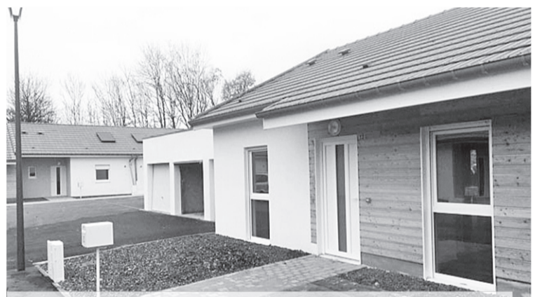
Улица, построенная из дерева белорусского производства в г.Окур-Мулен (Франция).

В ходе церемонии стороны обменялись заключенным контрактом на экспортную поставку домов. При этом французская делегация намерена уже в ближайшее время посетить Шклов для проведения переговоров о возможности дальнейшего нара-