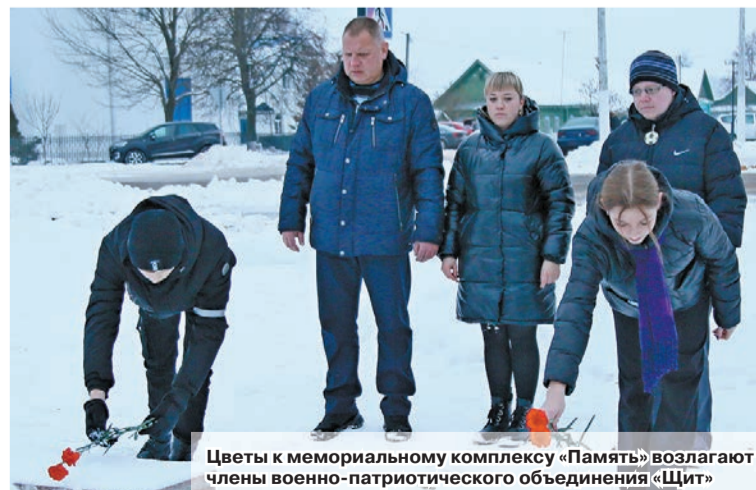
Цветы к мемориальному комплексу «Память» возлагают члены военно-патриотического объединения «Щит»