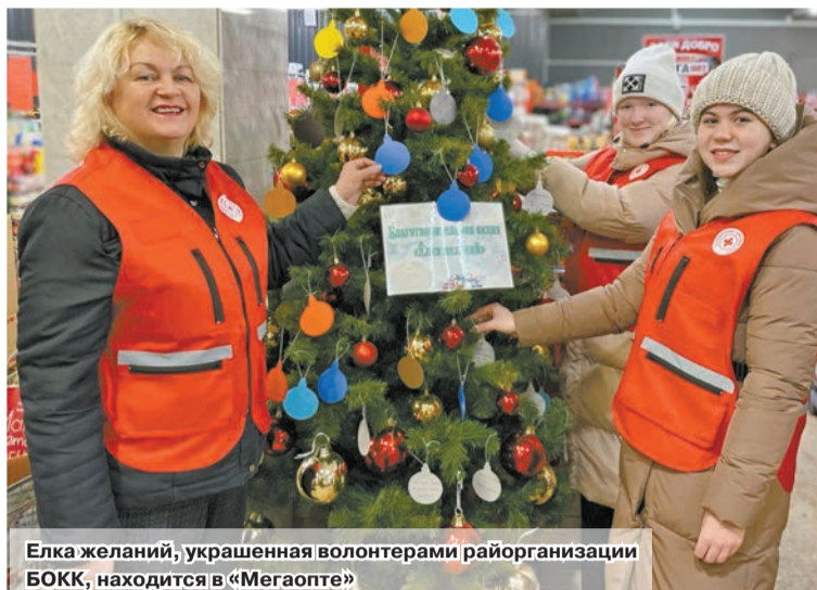
Елка желаний, украшенная волонтерами райорганizations БОКК, находится в «Мегаопте»

В канун Нового года все ждут подарков и чудес, и особенно дети. Однако не у всех есть возможность получить их от родных и близких. Но сегодня каждый неравнодушный человек может по-новогоднему порадовать ребенка, семья которого оказалась в сложной жизненной ситуации. Для этого нужно заглянуть в магазин «Мегаопт» на ул. Советской и поучаствовать в благотворительной акции «Елка желаний», которую проводит Белорусское общество Красного Креста.