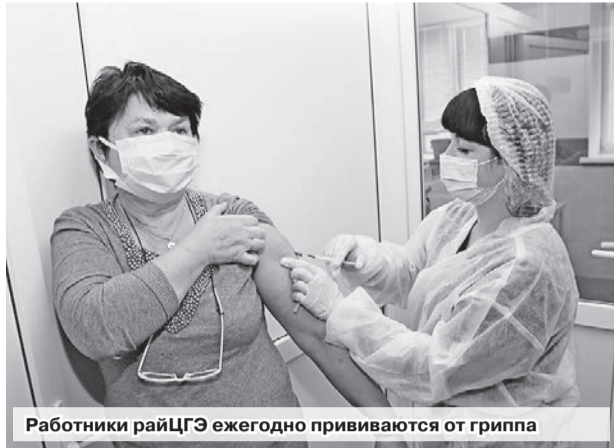
Работники райЦГЭ ежегодно прививаются от гриппа