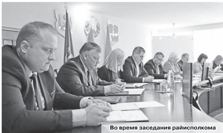
Во время заседания райисполкома

На внеочередном заседании районного исполнительного комитета рассмотрели сложившуюся систему ценообразования в сельском хозяйстве Республики Беларусь.