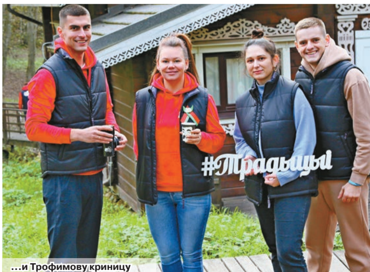
...и Трофимову криницу

Участники проекта воочию увидели красоту территории, где находится природный источник, узнали его историю. Затем состоялась экскурсия по агрогородку Александрия, которому присвоен статус деревни будущего. Посетили гости историко-краеведческий музей Александрийской средней школы и класс, в котором учился Президент Республики Беларусь Александр Лукашенко.