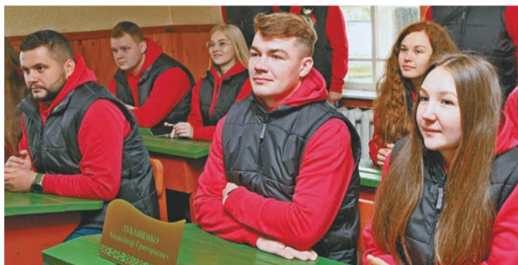
Участники автопоезда посетили класс, в котором учился Александр Лукашенко...

Не менее познавательной стала обзорная экскурсия «Шклов известный и неизвестный». Участники проекта узнали много интересного об истории Шкловского района и райцентра, познакомились с инфраструктурой и достопримечательностями.