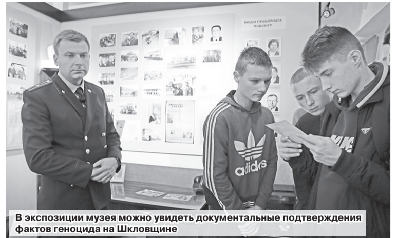
В экспозиции музея можно увидеть документальные подтверждения фактов геноцида на Шкловщине

Одним из ярких примеров геноцида и зверств, которые неизменно сопровождали приход немецких захватчиков, является территория возле кладбища в деревне Путники, где были расстреляны сотни мирных жителей. Побывали участники мероприятия и на еврейском кладбище. Подростки могли задавать вопросы, делиться мнением, но, пожалуй, молчание – это первая реакция, когда ужасающие факты