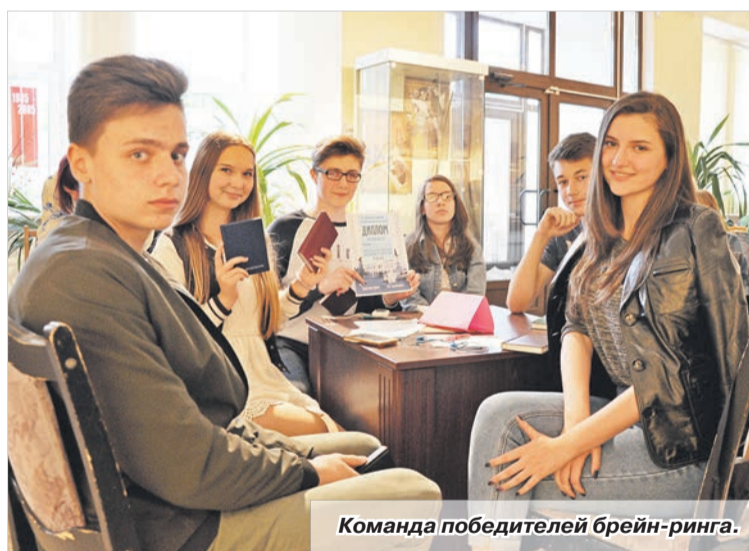
Команда победителей брейн-ринга.

Были подведены итоги и проведен конкурс среди учреждений образования «Петр Алейников – наш герой». Дипломы участников отправились в Старосельский УПК д/с – СШ, СШ №4, Городищенскую среднюю школу и в СШ №1. Победителем состязания стали ребята из Забродской средней школы. Ну а после выступления творческих талантов Шкловщины, которые и спели, и станцевали, зрители отправились непосредственно в обитель истории и культуры.