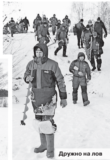
Дружно на лов

для каждого участника соревнований. За предоставленные призы организаторы соревнований выражают благодарность компаниям «MANKO», «Feeder.by» и ЧПУП «НагАЛ-Мебель».