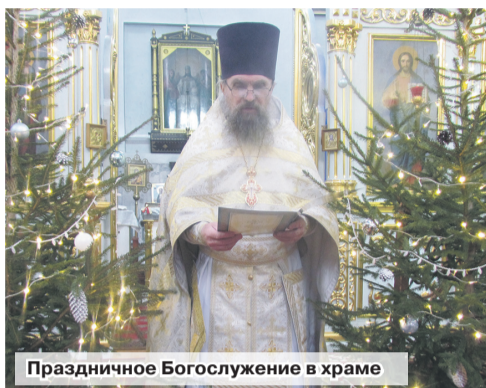
Праздничное Богослужение в храме

Христианам важно, чтобы Рождественская радость коснулась сердца каждого. А потому издавна было принято в святочные дни поддерживать тех, кто находится в тяжелой ситуации, кто болен, кто страдает. Даже небольшой подарок, скромное пожертвование, доброе слово могут помочь человеку во мраке обстоятельств увидеть свет Вифлеем-