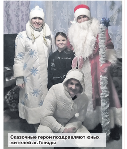
Сказочные герои поздравляют юных жителей аг.Говяды