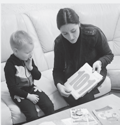
Сотрудники РОЧС рассказывают пациентам детской консультации о правилах безопасности

Зачастую в период новогодних праздников увеличивается количество пожаров и травм в результате нарушения правил пожарной безопасности. Чтобы предупредить чрезвычайные ситуации с подобными последствиями, работники РОЧС в рамках акции «Безопасный Новый год!» провели сразу несколько профилактических мероприятий.