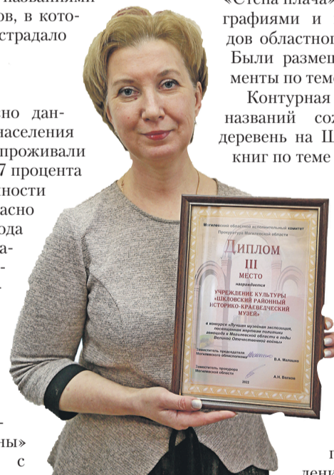
Работа шкловского музея оценена на высоком уровне

Ольга ДАНИЛОВА assol2711@mail.ru