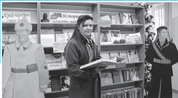
Читательница библиотеки с интересом знакомится с выставкой.