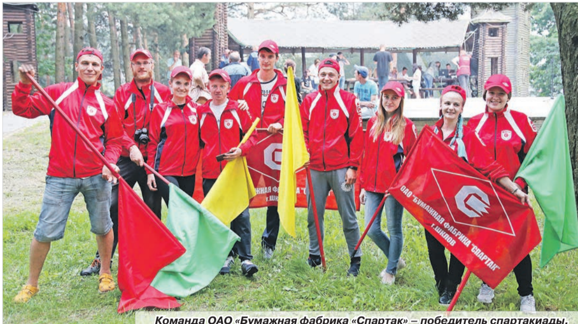
Команда ОАО «Бумажная фабрика «Спартак» – победитель спартакиады.

Организаторы подготовили для участников разнообразную программу, которой хватило бы и на пять дней. Однако, как и полага-