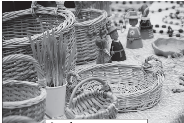
Волшебство народных ремесел.

И теперь я должна вернуться, Обрести себя где-то в теле. Но вопроса боюсь коснуться – Кто же я тут на самом деле?