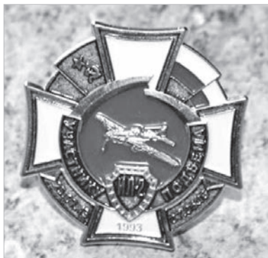
Награда за участие в подъеме самолета ИЛ-2.

Как происходят поисковые операции? Добровольцы в свободное время выезжают на 2-3-недельную вахту, предварительно изучив