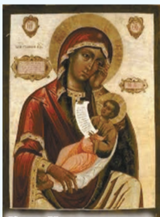
Икона «Утоли моя печали»