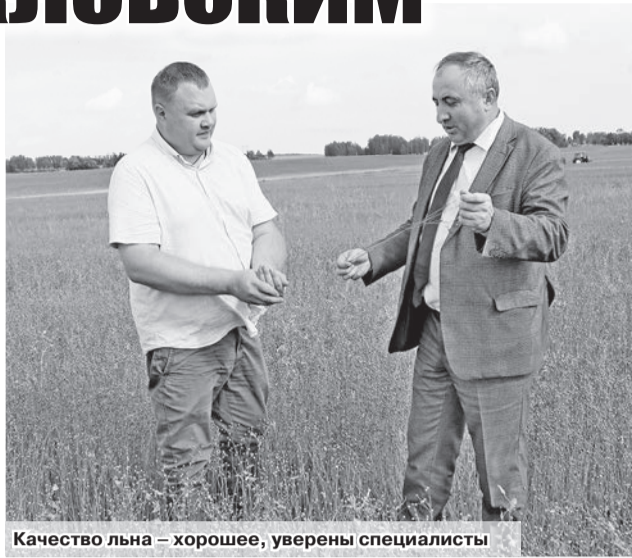
Качество льна — хорошее, уверены специалисты