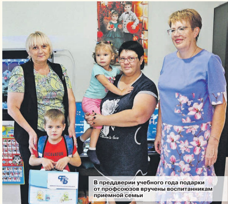
В преддверии учебного года подарки от профсоюзов вручены воспитанникам приемной семьи