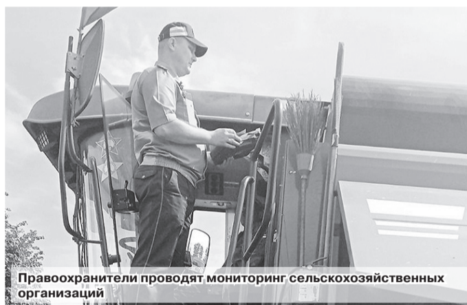
Правоохранители проводят мониторинг сельскохозяйственных организаций

Лето – горячая пора не только у аграриев, но и у правоохранителей. Пока сельские труженики обеспокоены уборкой урожая, служители закона осуществляют контроль над тем, чтобы она прошла без нарушений. Но без них не обходится.