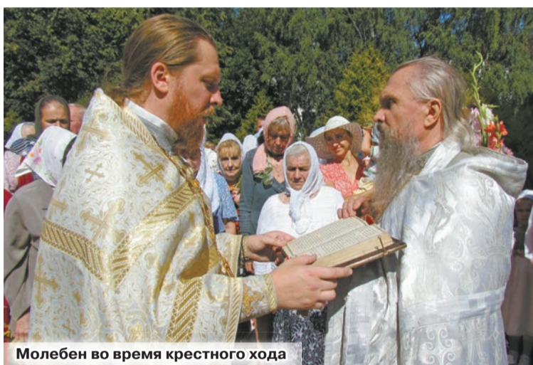
Молебен во время крестного хода

Велик праздник Преображения Господня. Узнал мир, что помимо света солнечного существует еще иной свет – Божественный. Свет солнечный животворит для жизни материальной, а кроме нее есть жизнь вечная, жизнь не материальная, а духовная. И как солнце – источник жизни телесной, так источник жизни вечной – в Господе Иисусе Христе. И этот Свет, просвещающий всякого человека, видели на горе Фаворской святые апостолы Иоанн, Иаков и Петр. На Фаворе они увидели Божественное Преображение Иисуса Христа, явление Его величия и славы. Лицо Спасителя стало подобным свету молнии, одежды – белыми, как снег. Он стоял окруженный сиянием, как солнце лучами. К Спасителю явились два пророка: Моисей и Илия и бесе-