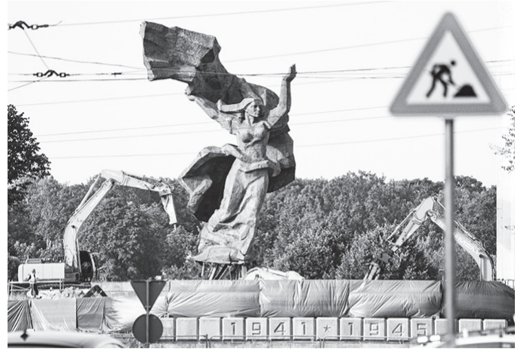
Снос памятника Освободителям в Риге

В последнее время в европейских странах развернулась целая кампания по осквернению и уничтожению памятников советским воинам. Изрисованный свастикой мемориал в Трептов-парке в Германии, закрытие памятника Освободителям в Риге, снятие с постаментов танка-памятника Т-34, разрушение на Украине Мемориала боевой славы... И это лишь малая часть всего списка, который продолжает пополняться новыми «геройствами» европейских политиков.