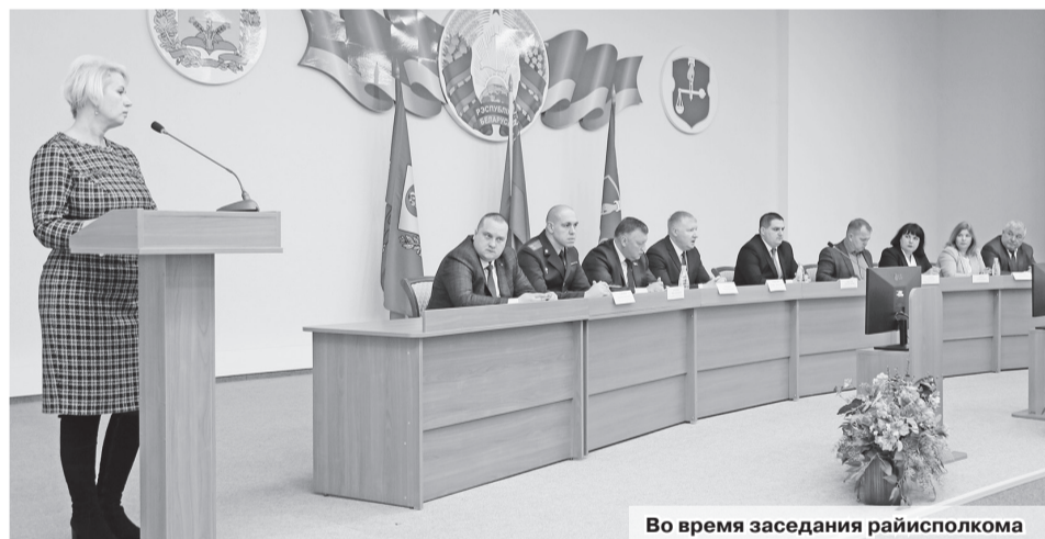
Во время заседания райисполкома