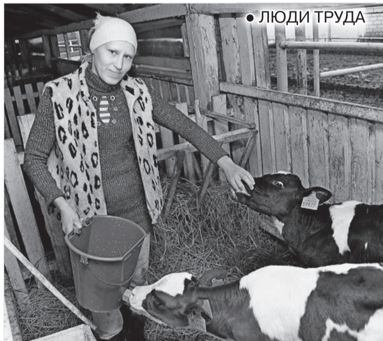
• ЛЮДИ ТРУДА