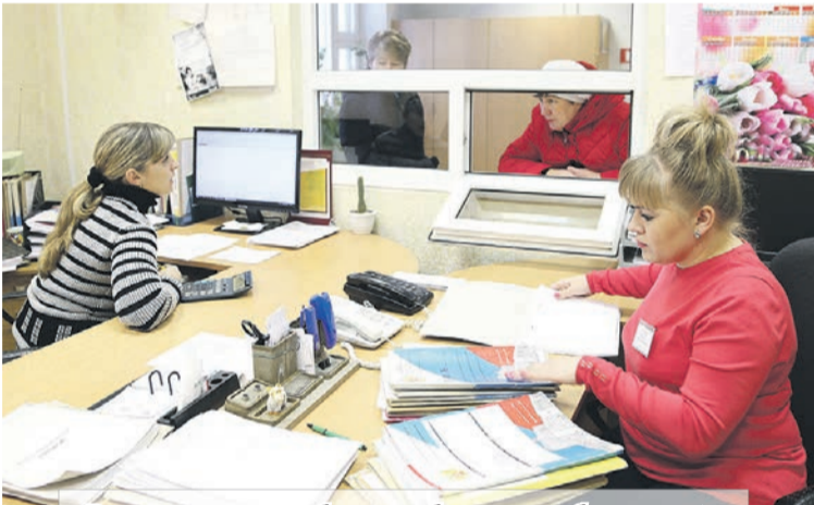
В столе справок работают с бытовыми абонентами.

... В диспетчерской РЭС дежурные круглосуточно следят за подачей электроэнергии всем абонентам. Здесь же принимаются звонки с сообщениями о каких-либо неполадках. Причиной нарушения электроснабжения может явиться все что угодно. Самыми экстремальными ситуациями работники называют