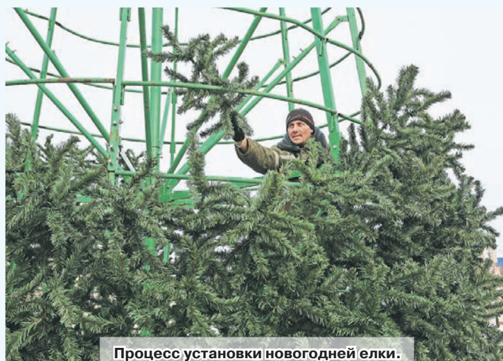
Процесс установки новогодней елки.

ние жителям будут и новогодние елки, расположенные в районе агросервиса, улицы Малой Заречной, а также в микрорайонах Молодежный и Энтузиастов. Их установка возложена на закрепленные организации. Вместе с тем, во всех агрогородках района будут установлены новогодние красавицы.