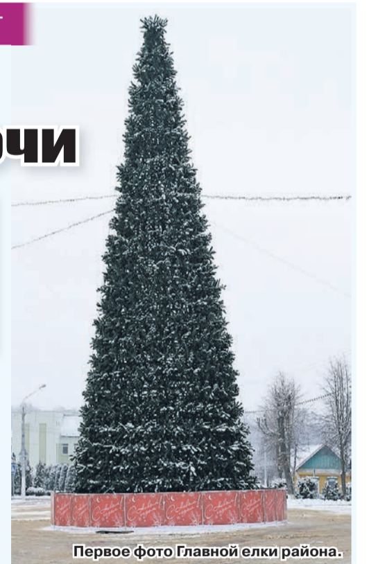
Первое фото Главной елки района.