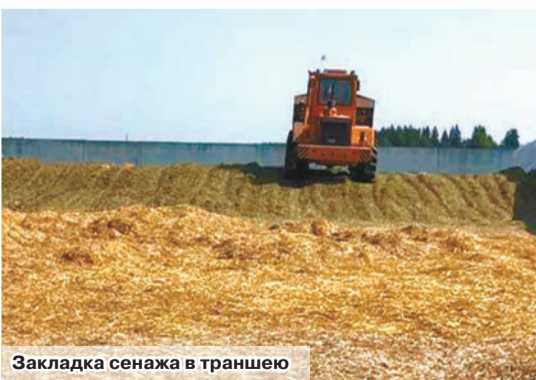
Закладка сенажа в траншею

– Сегодня мы должны максимально собраться и заготовить корма в оптимальные сроки. В 2023 году в сельхозорганизации планируем заготовить свыше 27 тысяч тонн кормовых единиц (107% по отношению к 2022-му), или 56 центнеров кормовых единиц на одну условную голову КРС. Сена – свыше 2080 тонн, сенажа – 31500, силоса – порядка 42500. Первый укос уберем с соблюдением всех техрегламентов, начиная с косейки и заканчивая закладкой сенажа. А это гарантия того, что хозяйство будет иметь хорошие и питательные корма.