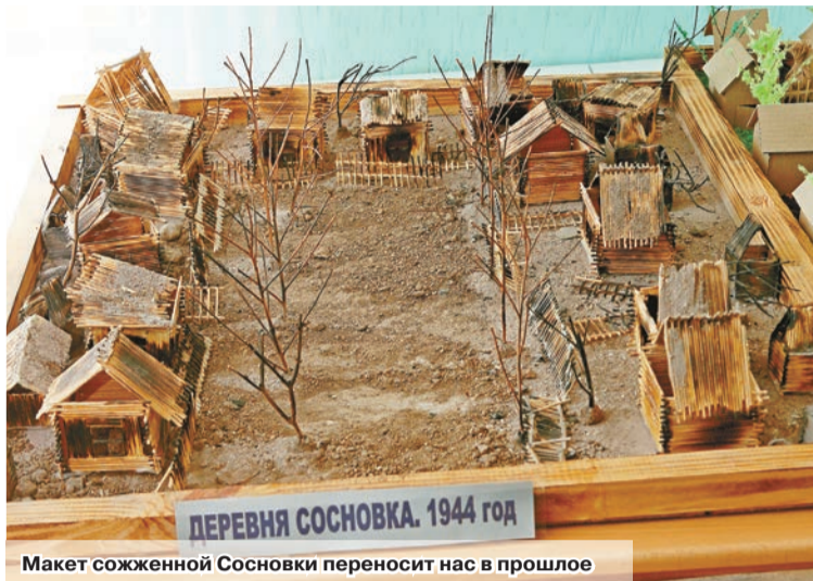
Макет сожженной Сосновки переносит нас в прошлое

Забродская средняя школа – одна из тех, где гражданско-патристическое воспитание организовано на очень достойном уровне. Проводятся различные мероприятия, приуроченные ко Дню Победы и другим значимым датам, уроки памяти и