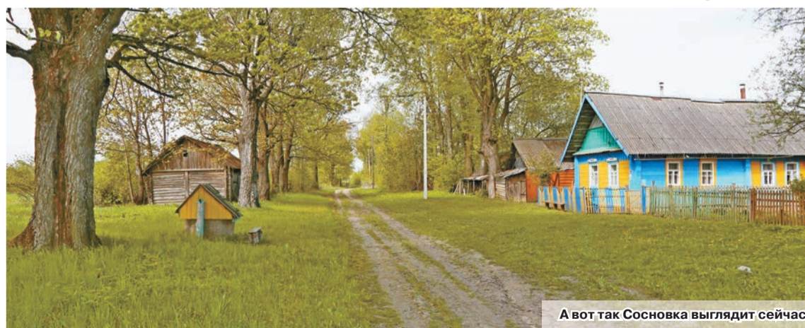
А вот так Сосновка выглядит сейчас