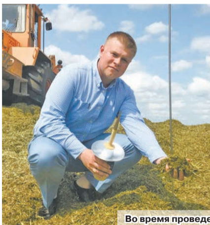
Во время проведения семинара-учебы