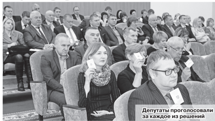
Депутаты проголосовали за каждое из решений

При рассмотрении вопросов, касающихся социально-экономического развития Шкловского района на 2023 год вниманию депутатов представлены ожидаемые итоги работы всех отраслей экономики за 2022-й. Особое внимание депутатов было направлено на проект районного бюджета, его сбалансированность и эффективность. Также внесены изменения в решения Шкловского районного Совета депутатов, касающиеся финансирования мероприятий государственных программ.