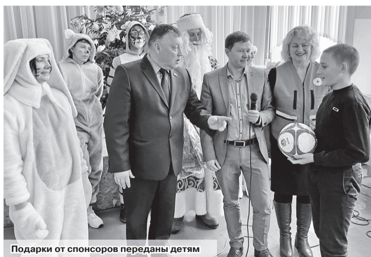
Подарки от спонсоров переданы детям

Марина РАНДИЦКАЯ marion795@mail.ru Фото автора