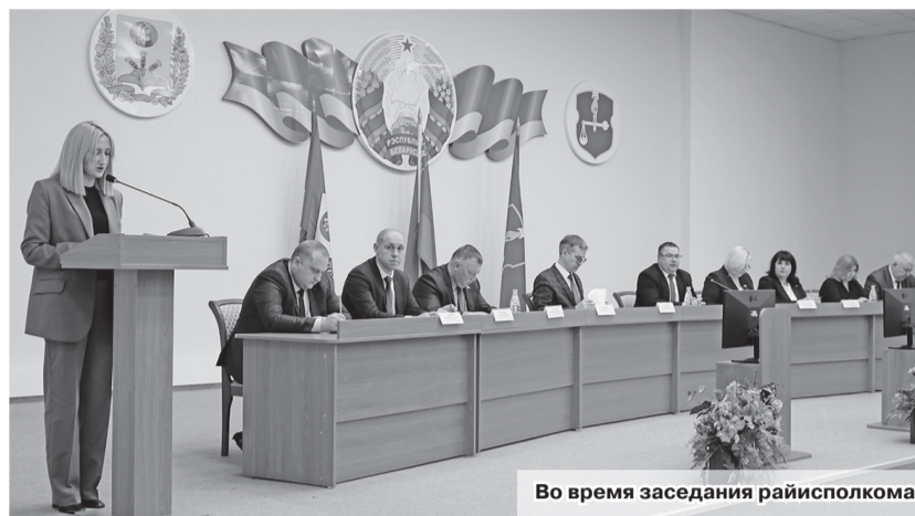
Во время заседания райисполкома

Ключевые показатели социально-экономического развития и проект бюджета района на 2023 год рассмотрены 29 декабря на заседании районного исполнительного комитета под председательством главы района Андрея Камко.