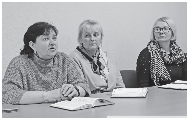
На правовом приеме граждан

Профсоюзы давно зарекомендовали себя как действенный инструмент защиты прав трудящихся в трудовых и социально-экономических вопросах. Причем содействие они оказывают не только практическое, но и разъяснительное. Каждый четвертый четверг профсоюзные правовые инспекторы посещают организации по стране, чтобы оказать юридическую помощь обратившимся, а заодно проконсультировать профсоюзных лидеров на местах о нюансах тех или иных вопросов.