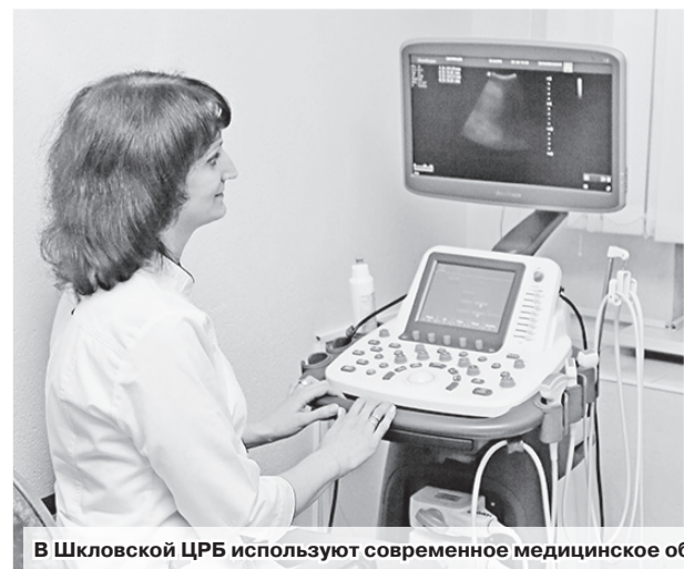
В Шкловской ЦРБ используют современное медицинское оборудование