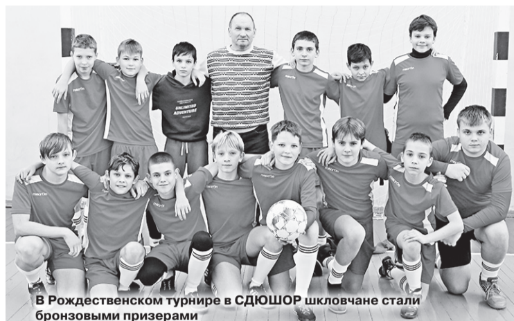
В Рождественском турнире в СДЮШОР шкловчане стали бронзовыми призерами

В преддверии новогодних праздников в Шклове прошли два Рождественских турнира по мини-футболу. Оба проводятся не первый год и собирают юных любителей этого вида спорта из разных городов. Главная цель турниров – пропаганда здорового образа жизни и вовлечение подростков в регулярные занятия физической культурой и спортом.