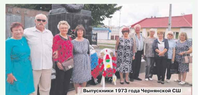
Выпускники 1973 года Чернянской СШ

Время неумолимо мчится вперед. Пятьдесят лет назад они были юными веселыми подростками, которые делали выбор профессии и не знали, как дальше сложится жизнь. А сегодня ими пройдено много дорог. Но свои школьные годы и друг друга они не забывают. Все это о выпускниках 1973 года Чернянской СШ, встреча которых состоялась недавно.