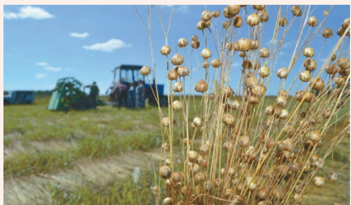
Уборочная страда на контроле мобильной группы райисполкома