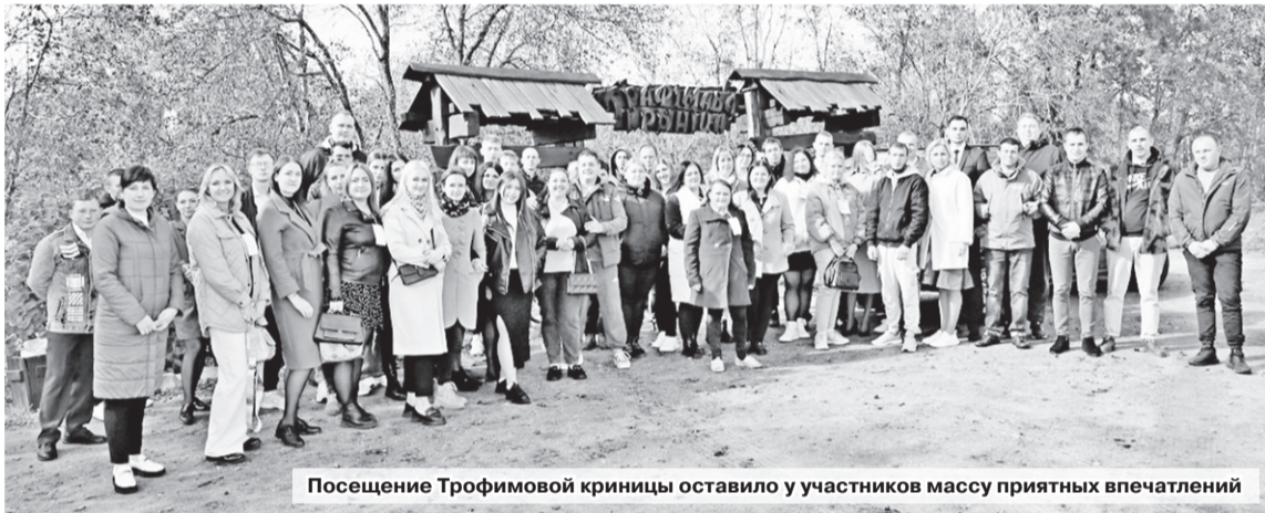
Посещение Трофимовой криницы оставило у участников массу приятных впечатлений