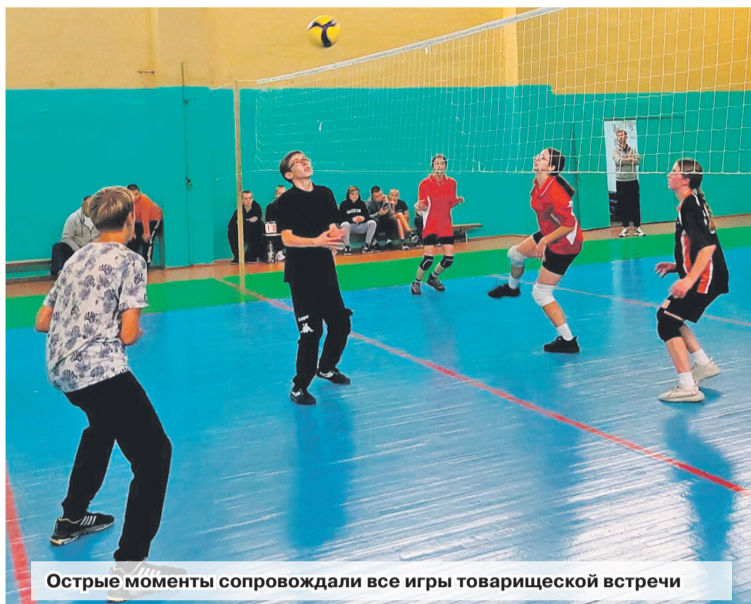
Острые моменты сопровождали все игры товарищеской встречи

Встреча проходила на базе Говядской СШ. Как и любой вид спорта, волейбол немалым без борьбы и спортивного накала. С первых минут игры команды настроены решительно: быстрый темп, четкие подачи, передачи и острые моменты. В ходе игры каждая команда боролась за победу, сплоченно идя к цели. Спортивный азарт, с которым играли команды, передавался всем болельщикам, присутствующим в зале.