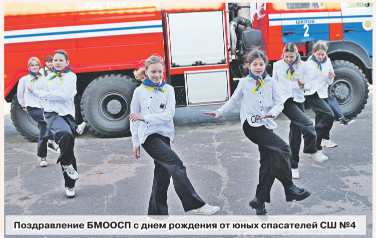
Поздравление БМООСП с днем рождения от юных спасателей СШ №4

Сотрудники РОЧС в свою очередь провели урок безопас-