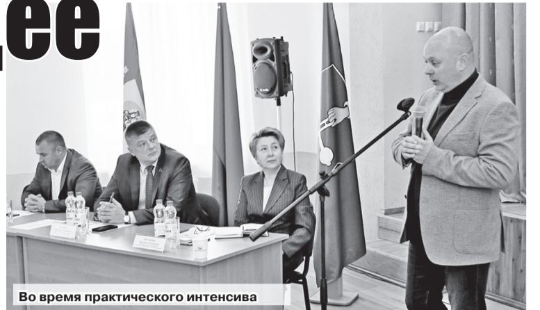
Во время практического интенсива

К слову, в ОАО «Александрійское» работает 288 представите-