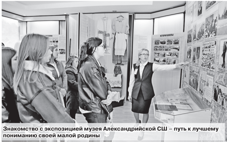
Знакомство с экспозицией музея Александрійской СШ – путь к лучшему пониманию своей малой родины

На прошедшей неделе в Александрии состоялся молодежный форум под названием «Молодежь и будущее». Он собрал работников организаций Управления делами Президента Республики Беларусь – ОАО «Александрійское», ЗАО «АСБ-Агро Городец», Шкловского маслодельного завода.