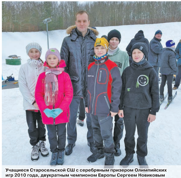
Учащиеся Старосельской СШ с серебряным призером Олимпийских игр 2010 года, двукратным чемпионом Европы Сергеем Новиковым