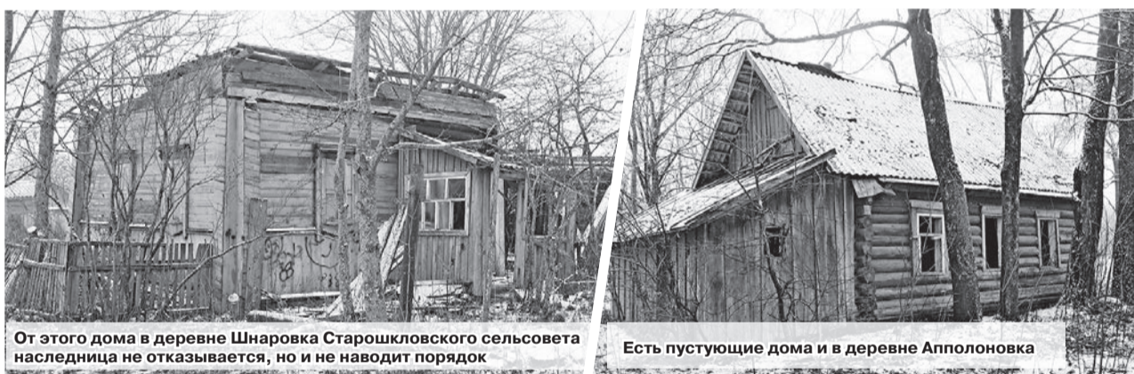
От этого дома в деревне Шнарровка Старошкловского сельсовета наследница не отказывается, но и не наводит порядок