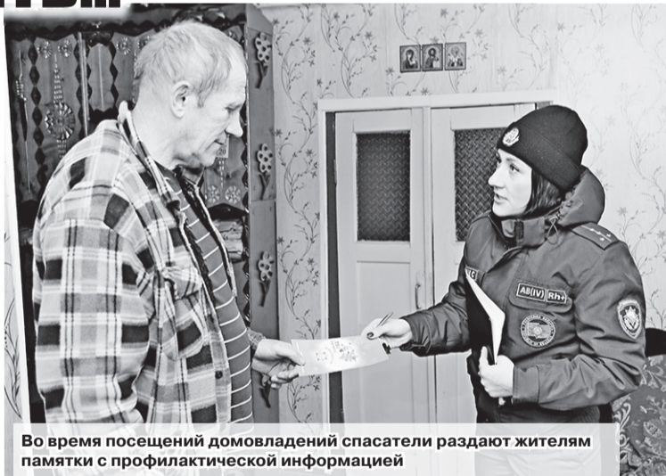
Во время посещения домовладений спасатели раздают жителям памятки с профилактической информацией