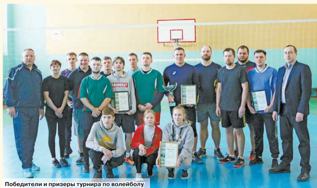
Победители и призеры турнира по волейболу

В минувшие выходные в агрогородке Говяды прошел турнир по волейболу, посвященный Дню памяти воинов-интернационалистов. Организаторами выступили Говядская средняя школа и центр детского творчества «Прамень».