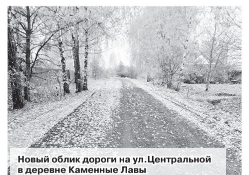
Новый облик дороги на ул.Центральной в деревне Каменные Лавы