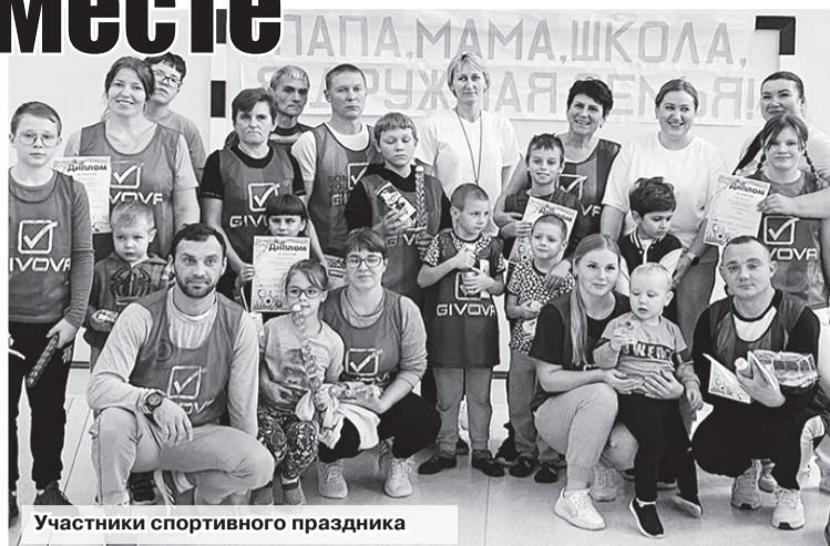
Участники спортивного праздника