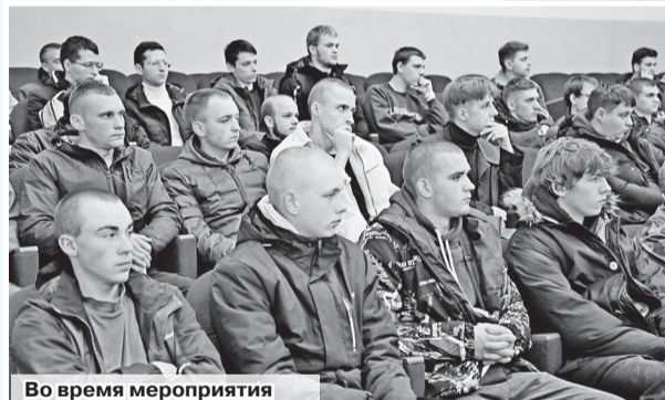
Во время мероприятия

мудрым и смелым, знающим цену настоящей мужской дружбе.