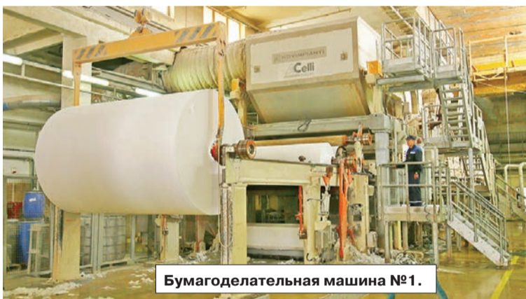
Бумагоделательная машина №1.