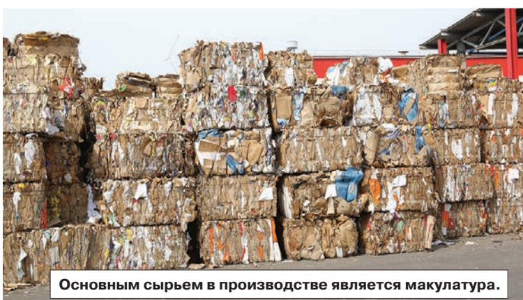
Основным сырьем в производстве является макулатура.

В 1910-м началось первое расширение и модернизация производства. В ходе капитального ремонта выросли новые фабричные корпуса, были установлены новые машины. Крыши покрыли железом, в помещениях провели паровое отопление. Результаты такой масштабной реконструкции предприятия не заставили