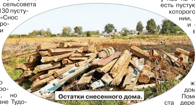
Остатки снесенного дома.

Что касается процесса сноса пустующих и ветхих домов, то Наталья Крикунова действует исключительно по закону. «Сносили мы только те дома, хозяева, наследники которых написали отказное письмо и дали согласие