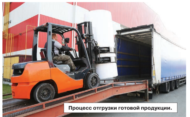
Процесс отгрузки готовой продукции.