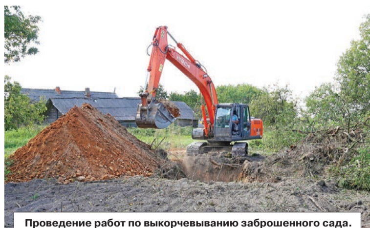
Проведение работ по выкорчевыванию заброшенного сада.