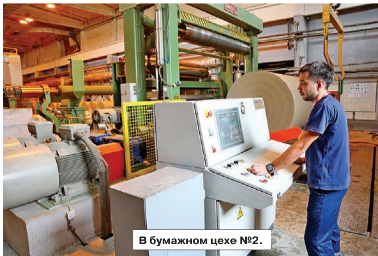
В бумажном цехе №2.

Архивные документы свидетельствуют, что в начале июля 1921 года наступил критиче-