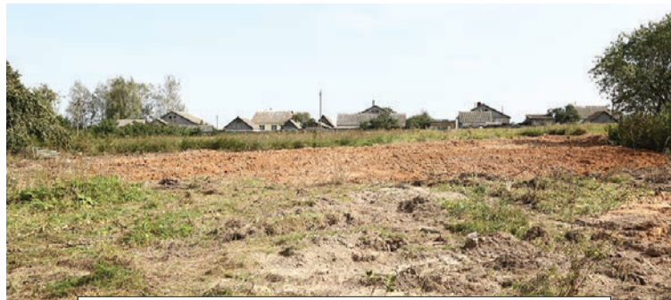
Благоустроенная территория после сноса дома.

Наталья КАЗЕБРОДСКАЯ, natali.ya1988@mail.ru